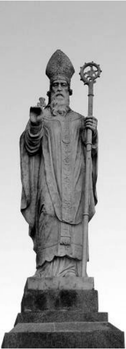
Patrick, Missionar, Bischof, geb.: um 385 in England, gest.: um 461 in Irland oder Frankreich, Patron von Irland

Viele gesicherte Daten über das Leben des Heiligen Patrick gibt es nicht, doch zahlreiche Legenden über ihn werden heute noch erzählt.